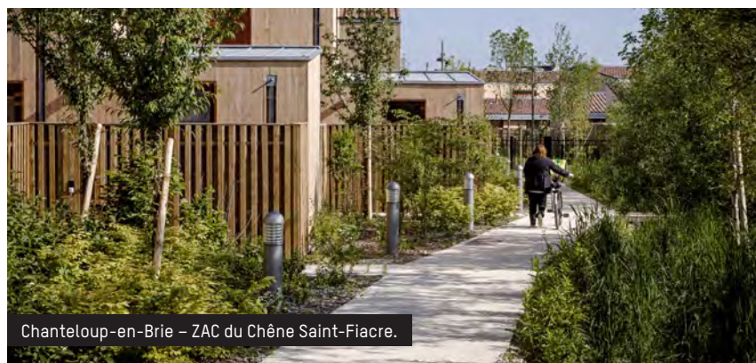
Chanteloup-en-Brie - ZAC du Chêne Saint-Fiacre.

Le bailleur social Immobilière 3F, lauréat 2016 pour la ZAC du Chêne Saint-Fiacre, Chanteloup-en-Brie (77)