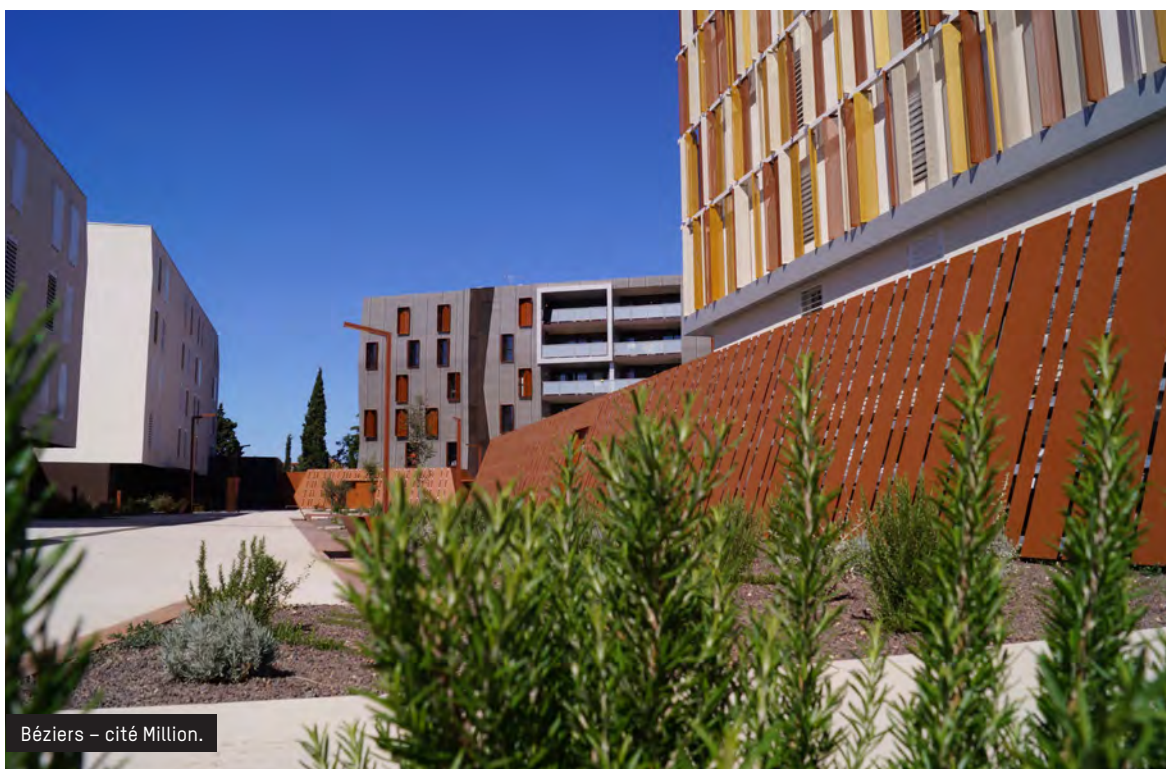
Béziers – cité Million.

Cette publication s'inscrit dans un dispositif complet de sensibilisation qui a débuté par la première Semaine des fleurs pour les abeilles , organisée par VAL'HOR du 20 au 27 juin, en partenariat avec l'Office français d'apiculture.