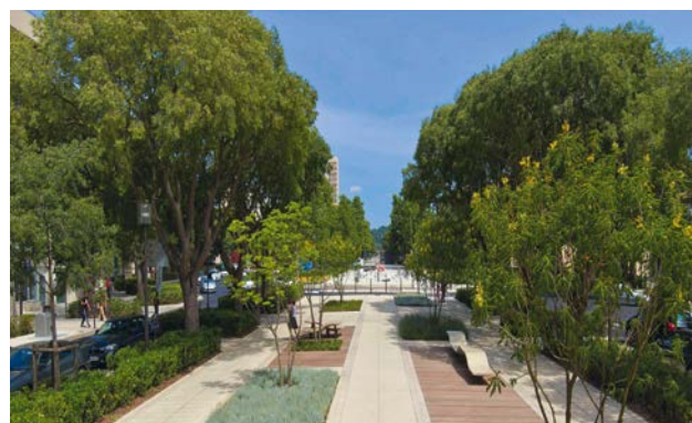
Ville de Nîmes, Grand Prix du Jury 2016

34 maîtres d'ouvrage ont été récompensés lors de la 5 ème édition. Le concours prend de l'ampleur avec la hausse du nombre de candidatures de près de 30% et un nouveau partenariat avec l'AJJH* qui parraine la catégorie Particulier. Professionnels du paysage, vous pouvez dès à présent mobiliser vos maîtres d'ouvrage pour participer à l'édition 2018.