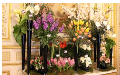
Mise en scène pour le lancement de l'APAF

* Association des Produits Agricoles de France