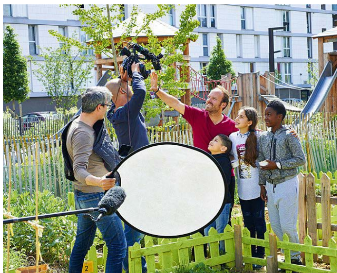
Episode N°72 de Mission : Végétal, réalisé dans le jardin partagé d'une résidence Hlm

> Lettre Cité Verte #11 consacrée à la végétalisation par les bailleurs sociaux : www.citeverte.com