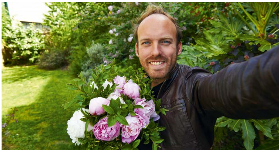
Gautier, animateur de Mission : Végétal

Avec plus d'un million de téléspectateurs à chaque émission sur M6 et plus de 41 000 fans sur Facebook, Mission : Végétal, le format court M6 parrainé par VAL'HOR continue tous les week-ends jusqu'au 9 juillet. Après la pause estivale, il reprendra début septembre jusqu'à fin décembre 2017.