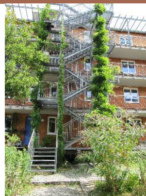
Eco Quartier de Fribourg . Visite lors des Assises Européennes du Paysage 2009.